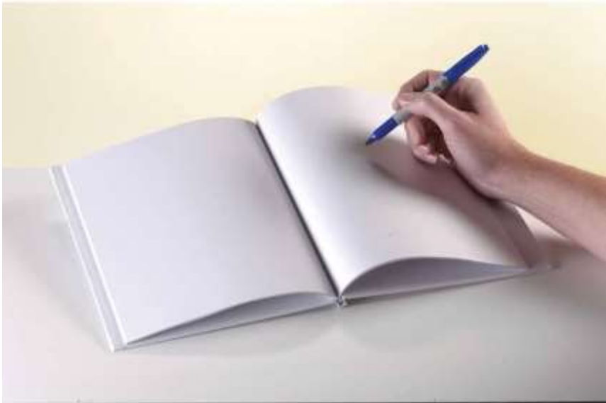
Gambar 2. Nama gambar seterusnya.