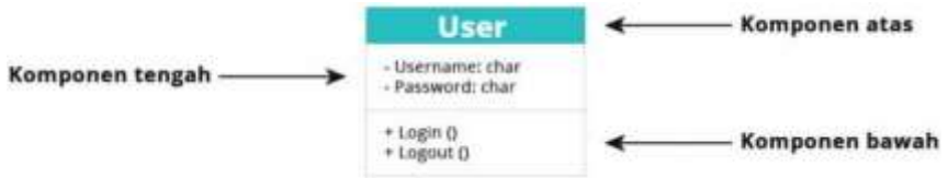
Gambar 1. Posisi letak nama gambar.